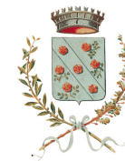
Comune di Rosate